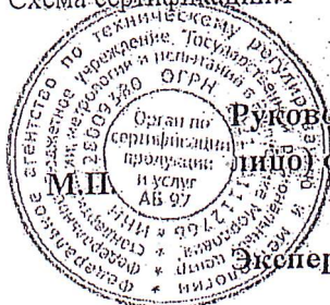
Схема сертификации: 1

Руководитель (уполномоченное лицо) органа по сертификации